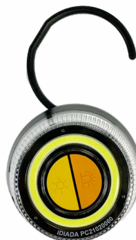
Función de ganchillo