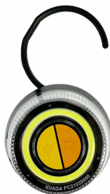
Fonction avec crochet